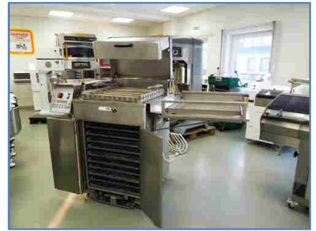
ES BACK 36er